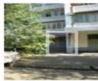
Рис. 4. Месторасположение парикмахерской

Собственнику желательно создать поток посетителей хотя бы 150 человек в неделю. Ассигнования, выделенные собственником на продвижение парикмахерской – не более 100 000 рублей. На той же улице четыре месяца назад открылась парикмахерская-конкурент на 4 посадочных места. Никаких услуг, кроме стрижки, не оказывают. Помещение крохотное, люди ждут своей очереди прямо в салоне. Работают 18-летние гастарбайтеры из Молдовы и Украины.